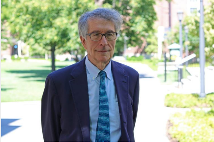
Howard Gardner (1943)

Psicólogo, investigador y profesor de la Universidad de Harvard.